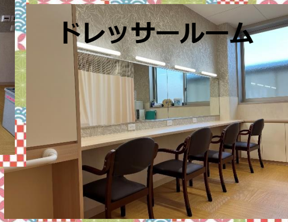
ドレッサールーム