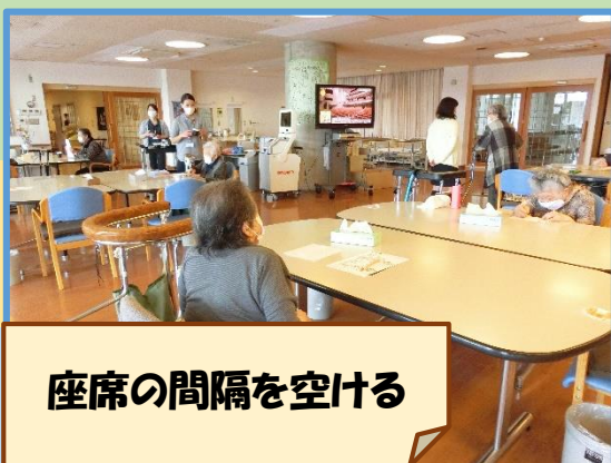
座席の間隔を空ける